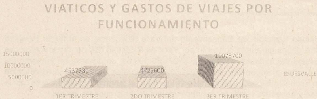
GRAFICO No 8. VIATICOS Y GASTOS DE VIAJE POR FUNCIONAMIENTO.