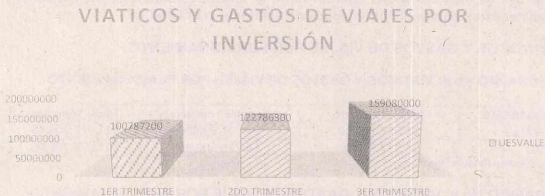
GRAFICO No 9. VIATICOS Y GASTOS DE VIAJES POR INVERSIÓN