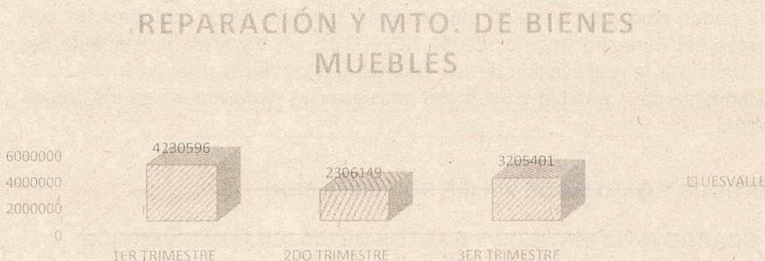
GRAFICO No 7 REPARACION Y MTO. DE BIENES MUEBLES