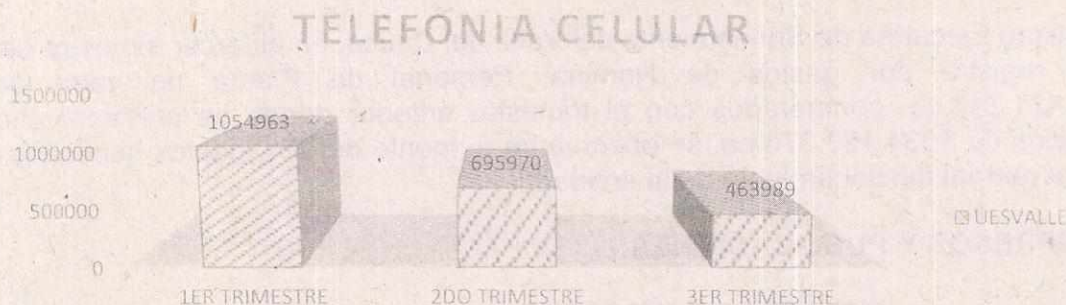
GRÁFICO No 3. TELEFONIA CELULAR.